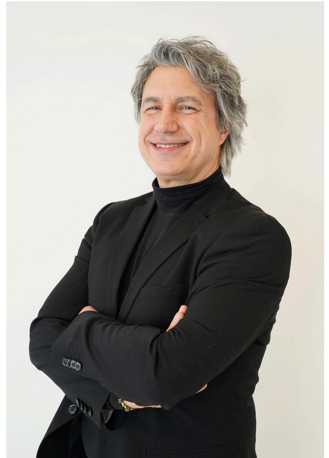
Presidente e Amministratore Delegato

La sua visione globale e il suo impegno per l'eccellenza hanno rafforzato in modo significativo il posizionamento di Monticolo&Foti Edilizia come una delle aziende leader nel settore.